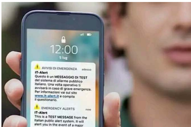
IT-Alert, in Val Seriana test per proteggere la popolazione dal rischio diga