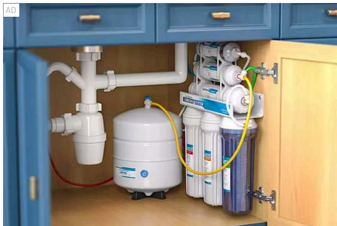
Depuratori d'acqua a zero spese con il Bonus Acqua Potabile 2024!

Scopri le novità uniche pensate esclusivamente per i pensionati SignorPrestito