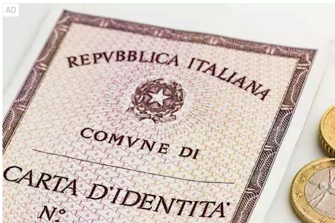
Sei pensionato? Ecco le agevolazioni di cui puoi usufruire

Scopri le novità uniche pensate esclusivamente per i pensionati SignorPrestito