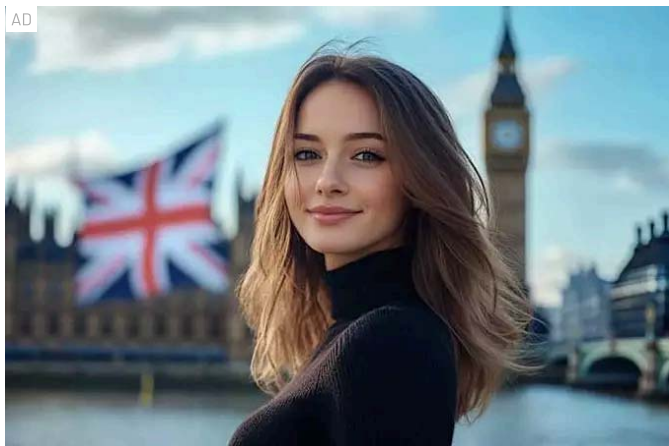
Parlare inglese: se conosci queste parole è un buon segno